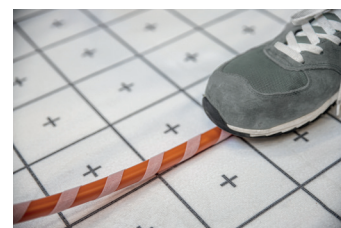
Estrema velocità di posa e massima versatilità