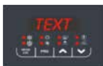
Comando a bordo macchina

Vitocal 100-A può essere gestita e monitorata dalla regolazione a bordo macchina e dai comandi ambiente Touch e Touch-Multi.