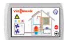
Comando Touch-Multi per il controllo in cascata fino a 7 unità