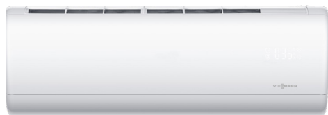
Vitoclima 300-Style: unità interna