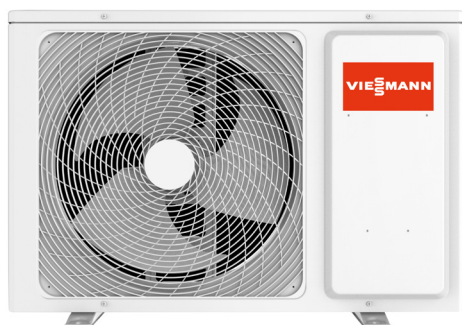
Vitoclima 300-Style: unità esterna