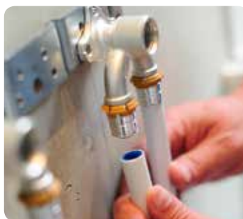
Igienicità e potabilità