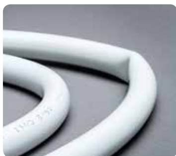
Tubo curvato rispetto a tubo piegato

Uni pipe PLUS è disponibile in rotoli, in barre e Isolato in rotoli sia per impianti sanitari, termici (Thermo) e di refrigerazione (Clima), con spessori di isolamento e caratteristiche in accordo con la normativa vigente