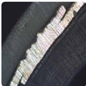
Alluminio saldato sovrapposto (attuale tecnologia)