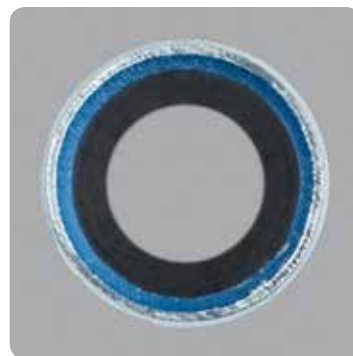
Uni pipe PLUS (nuova tecnologia SACP)