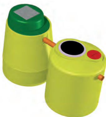
SUPERquattro Impianto a Fanghi Attivi

CATEGORIA PRODOTTO Impianto a Fanghi Attivi