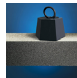
Resistente alla compressione