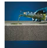
Resistente agli acidi