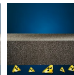
Protezione dal radon