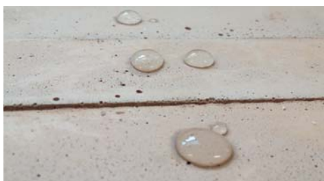
Il bassissimo assorbimento d'acqua proveniente sia da pioggia battente che da risalita capillare limita notevolmente la propagazione delle efflorescenze saline.