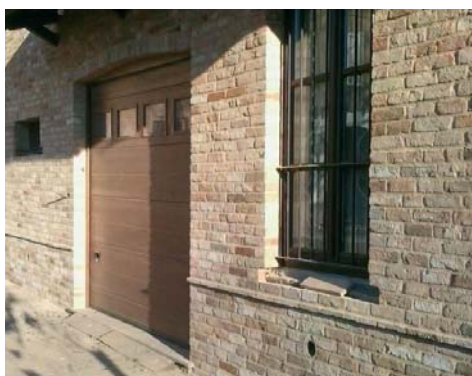
Applicazione di MFV10 Color per la realizzazione di murature faccia a vista.