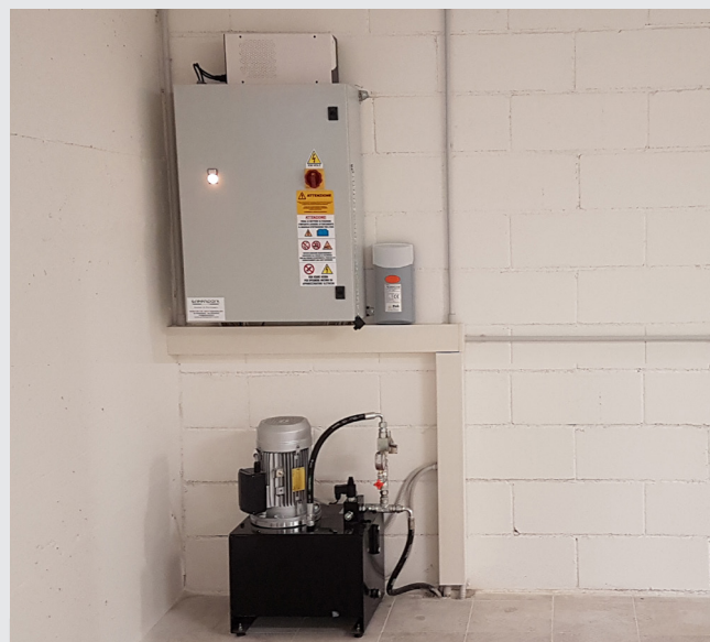
QUADRO MACCHINA E CENTRALE IDRAULICA