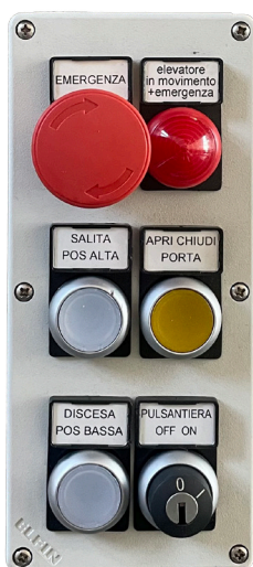
PULSANTIERA DI PIANO