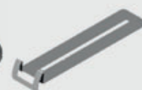
Clip Muro e Sideclips Gradino Wall clip and Step Sideclips P. 56