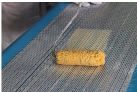
Fase 3: Pre-impregnazione con FASSA EPOXY 200