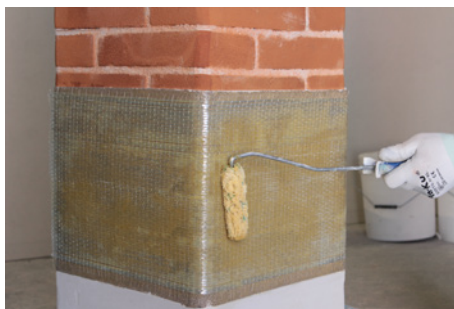
Fase 6: Impregnazione con FASSA EPOXY 200