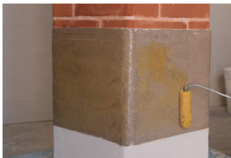
Fase 2: Applicazione di FASSA EPOXY 200