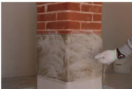
Fase 7: Applicazione a spolvero di sabbia