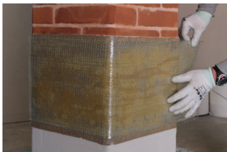
Fase 5: Posizionamento di FASSATEX GLASS 300