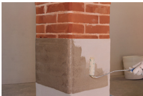
Fase 1: Trattamento con FASSA EPOXY 100, ove necessario