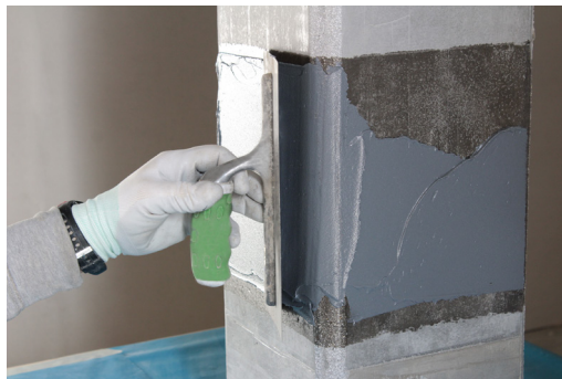
Fase 2: Regularizzazione con FASSA EPOXY 400