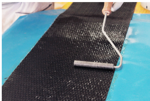
Fase 4: Omogeneizzazione dell'impregnante