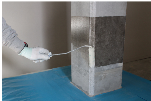
Fase 1: Trattamento con FASSA EPOXY 100, ove necessario