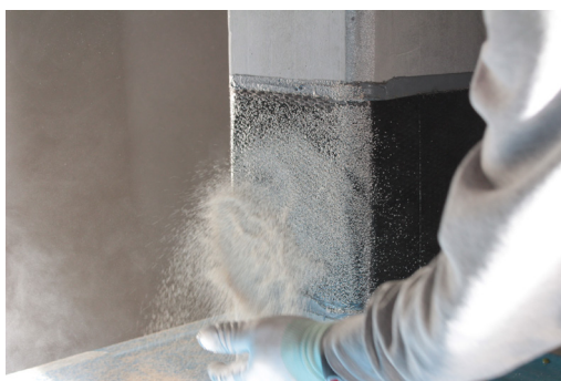
Fase 7: Applicazione a spolvero di sabbia