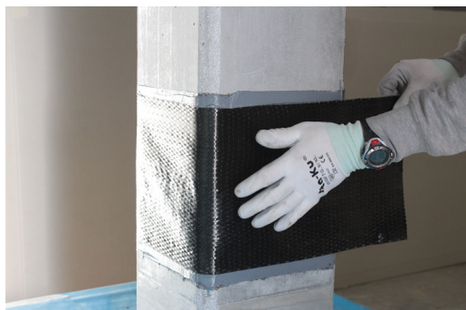
Fase 5: Posizionamento di FASSATEX CARBON UNI 300 / 600