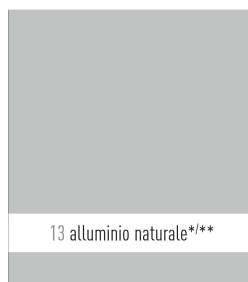
13 alluminio naturale*/**