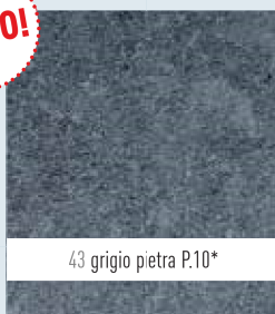
43 grigio pietra P.10*