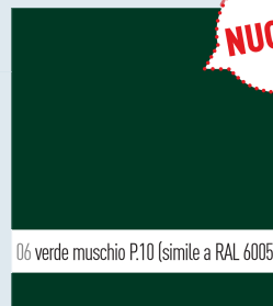
06 verde muschio P.10 (simile a RAL 6005)