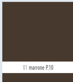
01 marrone P.10

Colori disponibili per tegole, tegole R.16, scandole, scaglie e FX.12 tetto.