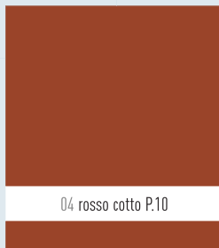
04 rosso cotto P.10