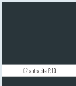
02 antracite P.10