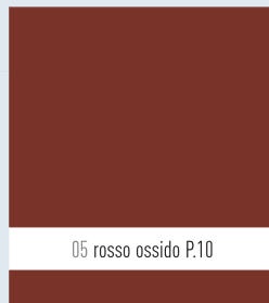
05 rosso ossido P.10