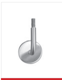
Mensola in acciaio inox