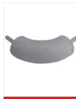
Angolo interno o esterno in legno