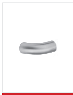
Terminale standard in inox