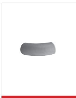
Terminale standard in legno