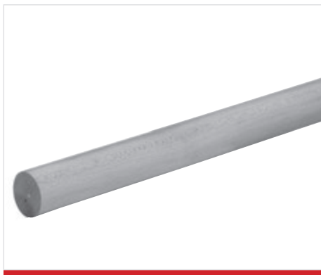
Lunghezza standard 2 m faggio massiccio