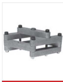
Maschera di foratura per terminale