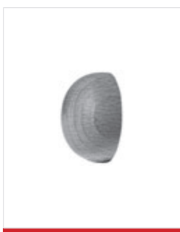
Tappo di chiusura in legno