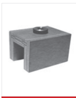
Maschera di foratura per mensola