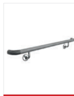
In opzione: corrimano tagliato e preassemblato su misura con 3 verniciature a scelta (mogano, quercia e noce). Consegnato pronto per l'installazione