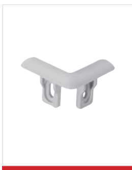
Terminale di chiusura