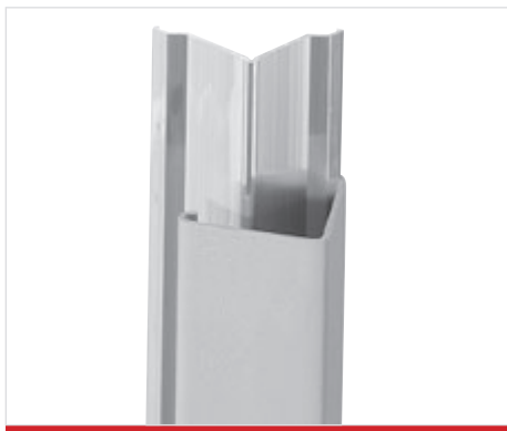
Lunghezza standard di 3 m