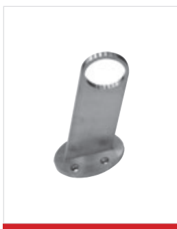
Supporto in acciaio inox