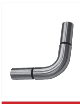
Angolo interno o esterno