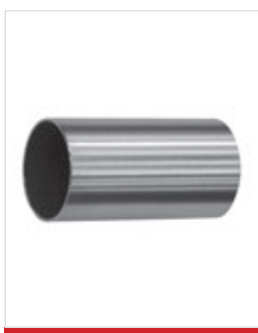
Giunto di raccordo