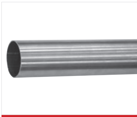
Tubolare Ø 51 mm Lunghezza standard di 3 m