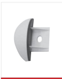
Terminale standard con anello decorativo nero