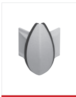
Angolo esterno con anelli decorativi neri