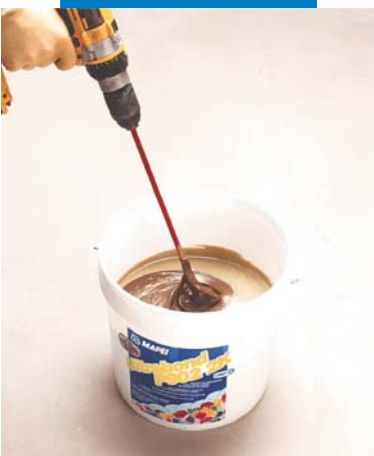
Miscelazione dei componenti

L'umidità del massetto deve essere misurata con l'igrometro a carburo. Per risolvere i casi di umidità residua superiori al limite previsto per la posa, è necessario attendere l'asciugamento del massetto o applicare gli opportuni primer impermeabilizzanti quali Eco Prim PU 1K , Primer MF , Triblock , Primer PU60 , ecc. I sottofondi non sufficientemente solidi, debbono essere rimossi o, dove possibile, consolidati con primer tipo Eco Prim PU 1K , Primer MF , Primer EP , Primer PU60 , Profas , ecc.