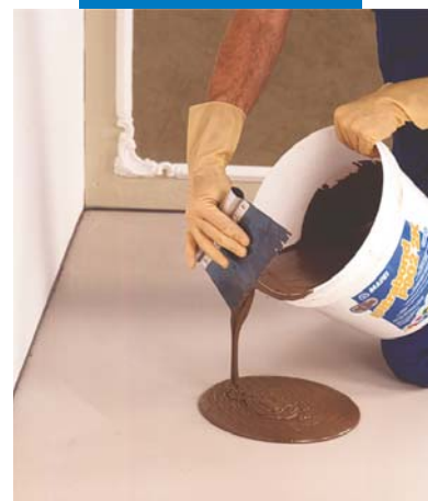
Sbavatura dell'adesivo con la spatola