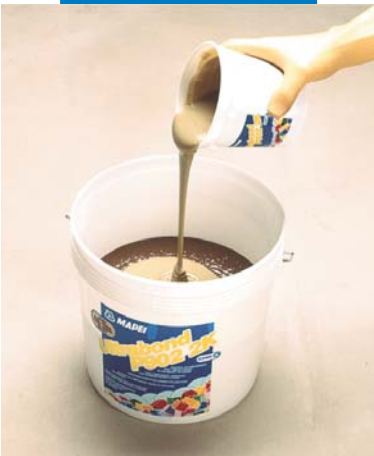
Travasamento dell'induritore (componente B) nel collante (componente A)