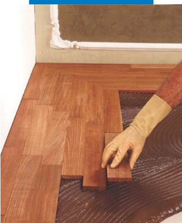
Posa di un listoncino di Teak da 14 mm