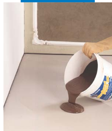
Versamento dell'adesivo sul massetto