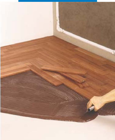
Stesura dell'adesivo con spatola dentata da legno