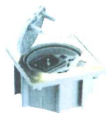
KSE150/23/71 Portameccanismo chiusura manuale, con 1 presa tedesca, 1 presa RJ4S cat Se UTP, finitura ottone, IP66