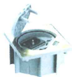
KSE123/71 Portameccanismo chiusura manuale, con 1 presa tedesca, finitura ottone, IP66