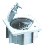
KSE1SEC/23/72* Portameccanismo chiusura di sicurezza, con 1 presa tedesca, finitura acciaio inossidabile, protezione IP66