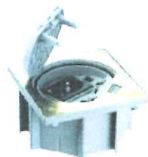
KSE160/23/71 Portameccanismo chiusura manuale, con 1 presa tedesca, 1 presa RJ4S cat 6e UTP, finitura ottone, IP66