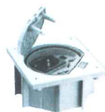
KSE150/23/72 Portameccanismo chiusura manuale, con 1 presa tedesca, 1 presa RJ4S cat Se UTP, finitura acciaio inossidabile, IP66