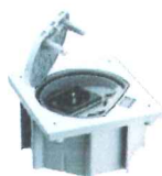
KSE123/72 Portameccanismo chiusura manuale, con 1 presa tedesca, acciaio inossidabile, IP66