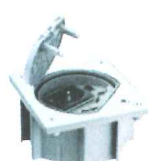
KSE15USEC/23/72* Portameccanismo chiusura di sicurezza, con 1 presa tedesca, 1 presa RJ4S cat. Se UTP, finitura acciaio inossidabile, protezione IP66