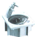
KSE160/23/72 Portameccanismo chiusura manuale, con 1 presa tedesca, 1 presa RJ4S cat 6e UTP, finitura acciaio inossidabile, IP66