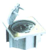
KSE15USEC/23/71* Portameccanismo chiusura di sicurezza, con 1 presa tedesca, 1 presa RJ4S cat. Se UTP, finitura ottone, protezione IP66