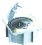
KSE1SEC/23/71* Portameccanismo chiusura di sicurezza, con 1 presa tedesca, finitura ottone, protezione IP66 grigio