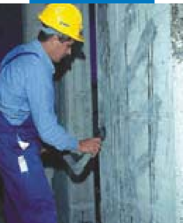
Preparazione del supporto