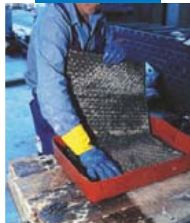
Impregnazione manuale di Mapewrap C

Verificare che lo strato di Mapewrap 11 o Mapewrap 12 sia ancora fresco, quindi procedere immediatamente all'applicazione di Mapewrap C Quadri-AX avendo cura di stenderlo senza lasciare alcuna grinza. Dopo averlo spianato con le mani (sempre protette con guanti di gomma), passare più volte un rullo di gomma rigida sulla superficie nella direzione longitudinale delle fibre allo scopo di farlo penetrare perfettamente nello stucco epossidico Mapewrap 11 o Mapewrap 12 e, successivamente, per eliminare completamente le eventuali bolle d'aria, ripassare con apposito rullo in alluminio tipo vite senza fine.