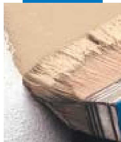
Rivestimento con Elastocolor