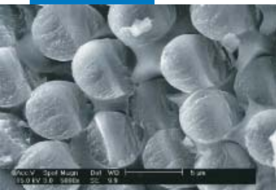
Microfotografia di un composto strutturale a matrice polimerica dal Laboratorio di Ricerca e Sviluppo Mapei

Le referenze relative a questo prodotto sono disponibili su richiesta