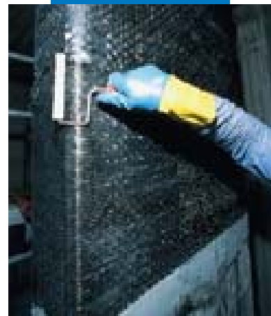
Applicazione della 2ª mano di Mapewrap 31