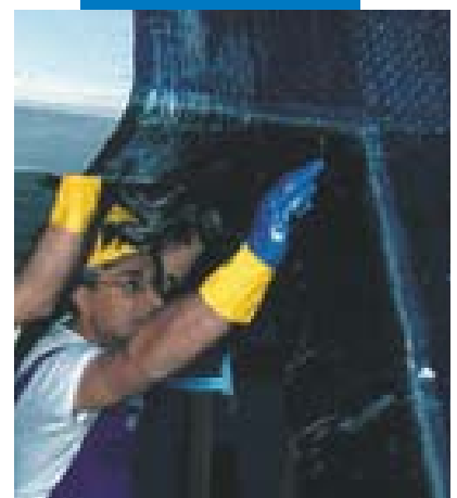
Fasciatura di un nodo