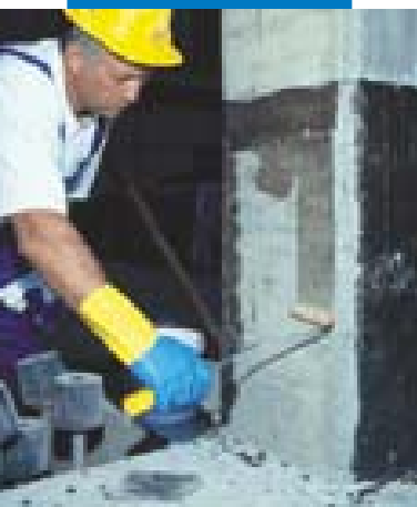
Applicazione di MapeWrap Primer 1