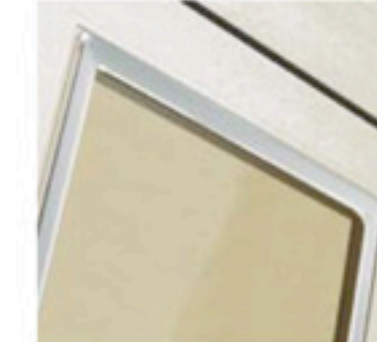
Cromato / Chromed / Verchromt