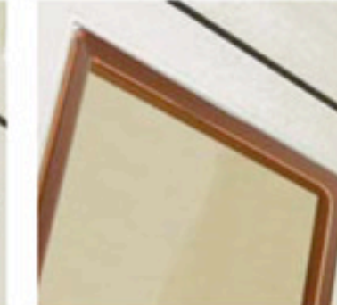
Bronzato / Bronzed / Bronze