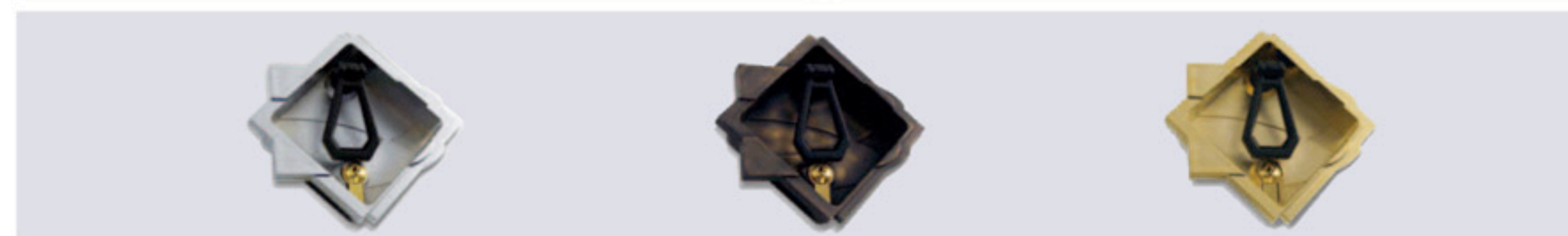
Cromata / Chromed / Verchromt