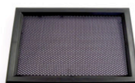
Nero / Black / Schwarz