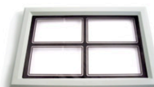
Bianco / White / Weiss