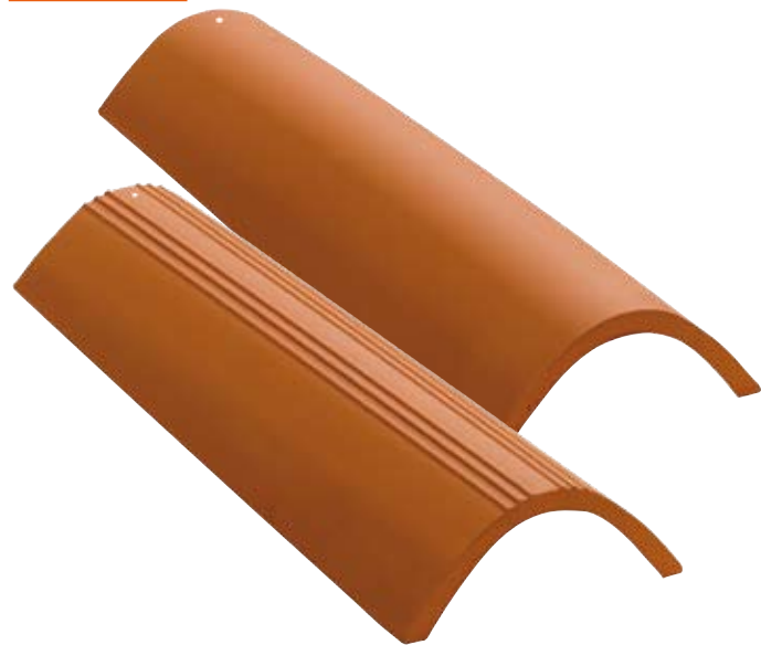
BASE PER COMIGNOLO