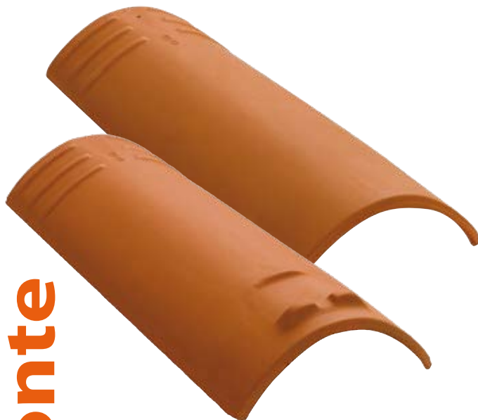
BASE PER COMIGNOLO