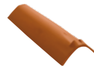
COPPO DI CANALE MONODENTE

Si posa su piano portante discontinuo. Grazie alla sua particolare forma con dente, a contatto con il listello garantisce una perfetta stabilità anche a pendenze elevate. E' particolarmente adatto sia alla tradizionale intelaiatura orizzontale del tetto alla "lombarda" sia alla posa su pannelli isolanti prestampati.