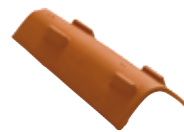
COPPO DI CANALE QUATTROPIEDI

Si posa su piano portante continuo, caldana o pannello isolante, con estrema facilità ed è possibile prevedere il fissaggio con il coppo di coperta attraverso l'uso di ganci metallici. Studiato appositamente per evitare scivolamenti, ribaltamenti laterali e perdite di tenuta all'acqua.