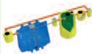
RAIN Impianto di trattamento acque di prima pioggia