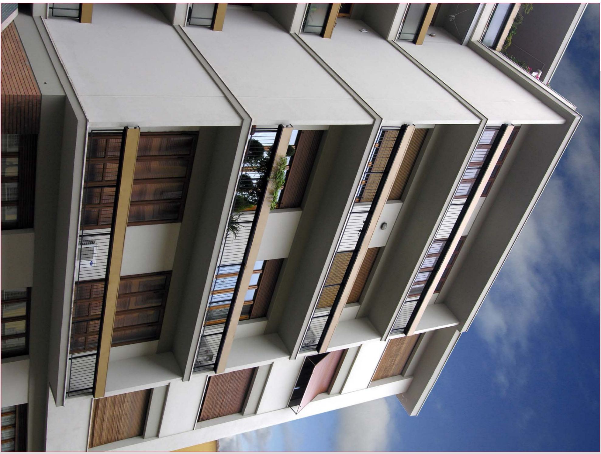
EDIFICIO MULTIPIANO CON BALCONI "A NICCHIA" SU CUI INSTALLARE IL SISTEMA .CDF+

FASI DI CHIUSURA-APERTURA DELL'ELEMENTO STENDITROIO