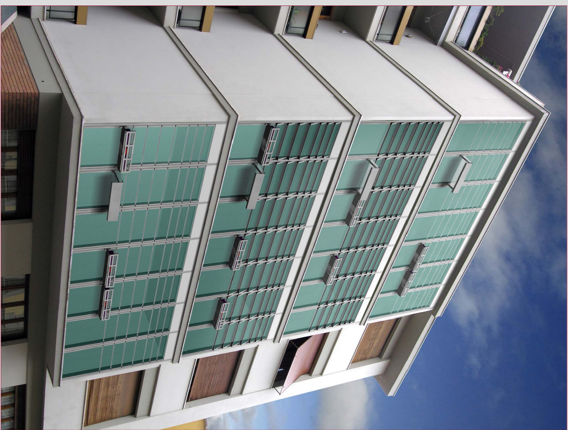
EDIFICIO MULTIPIANO CON BALCONI "A NICCHIA" CON SISTEMA .CDF+ INSTALLATO