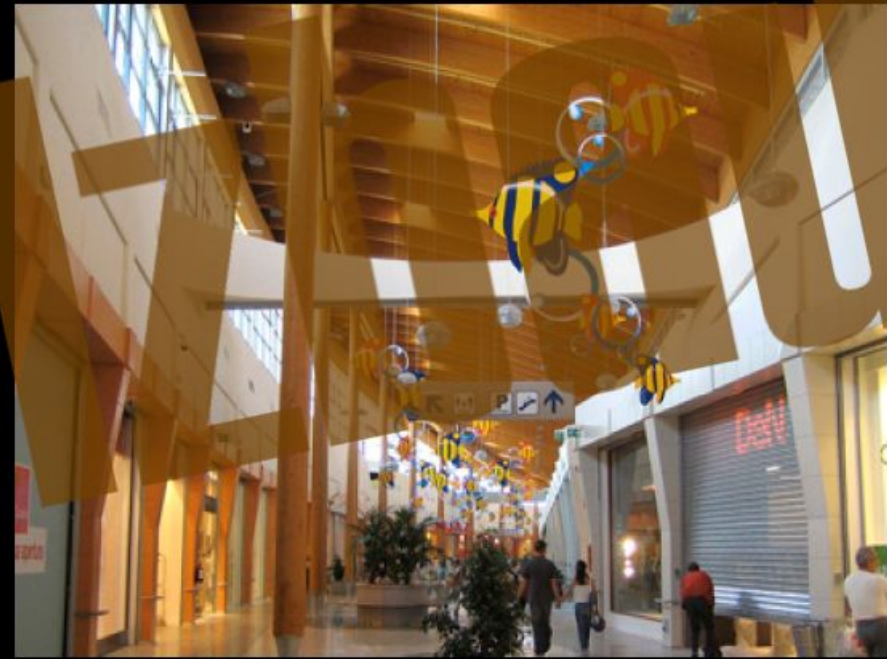
Mall principale ovest