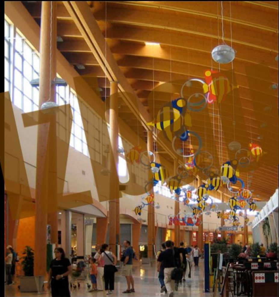
Mall principale food court