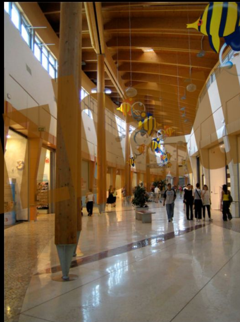
Mall principale ingresso ovest