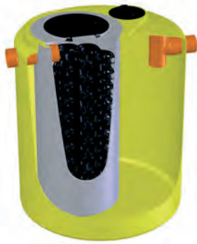
ANAPACKAGE Impianto a Filtro Percolatore

CATEGORIA PRODOTTO Impianto a Filtro Percolatore