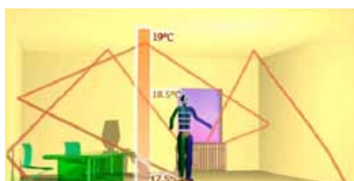
Temperatura interna con GP SunZenit Nanotech interior