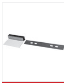
Giunto di raccordo per pezzi di lunghezza superiore a 4 metri