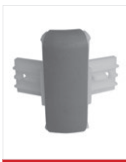
Angolo interno speciale Specificare la graduazione (da 98° a 165°)