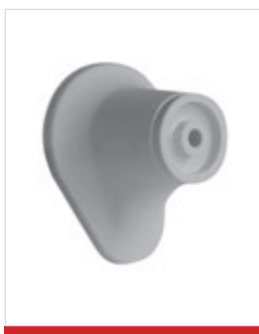
Mensola di fissaggio