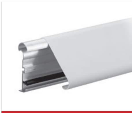
Lunghezza standard di 4 m