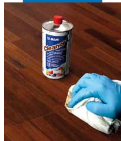
Pulizia di parquet prefinito di grande formato con Cleaner L