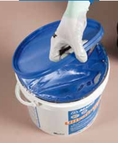
Facile rimozione del coperchio