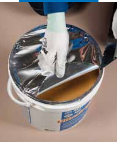
Facile e veloce rimozione della pellicola sigillante