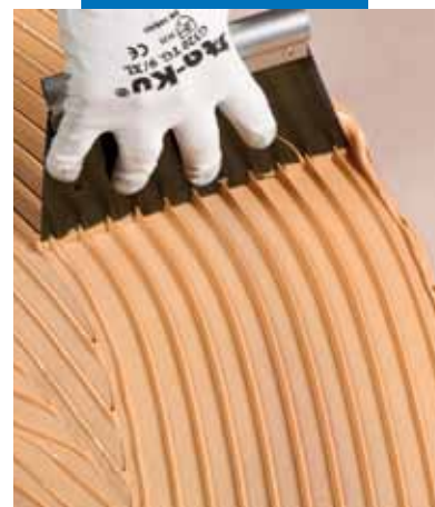
Ottima tenuta della riga e lavorabilità