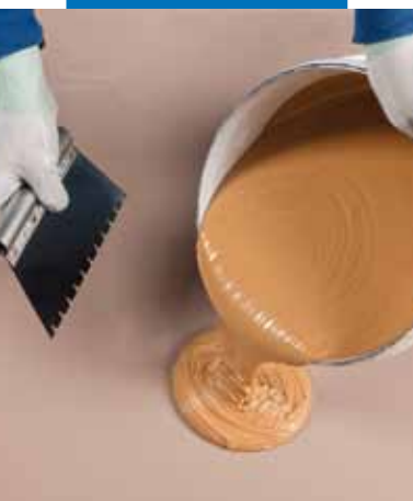
Ottima conservazione e stabilità del prodotto