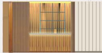
BAR DEL FOYER - SC 1.50

Lo spazio bar viene recuperato rispettando l'originario carattere degli elementi architettonici e decorativi che definiscono l'ambiente del foyer.