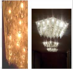
PiANTA FOYER (2.76) - SC 1.100

L'intervento di recupero e valorizzazione dell'ambiente del foyer mira a conservare ed enfatizzare gli elementi di arredo esistenti. Tra questi i grandi lampadari in cristallo che devono essere oggetto di una adeguata manutenzione che ne garantisca il perfetto funzionamento.