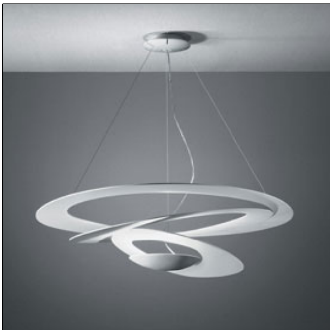
1239010A Pirce sospensione Bianco

Da un disco sottile si aprono volute fluttuanti, che ricadono morbidamente verso il basso, creando magici effetti di forma e luce.